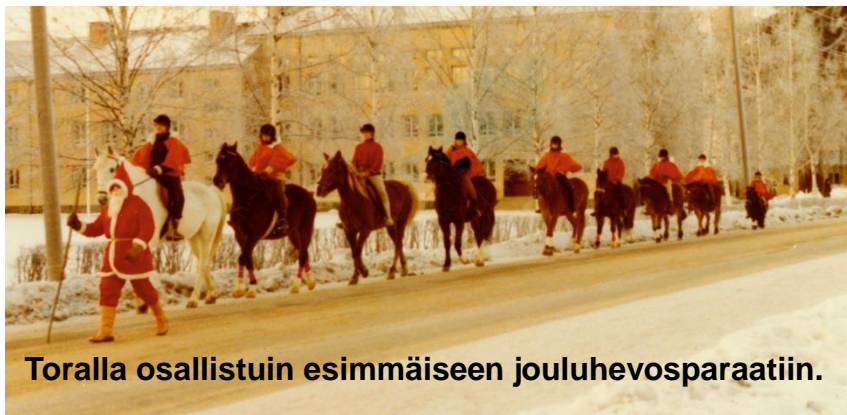
Toralla osallistuin ensimmäiseen jouluhevosparaatiin.