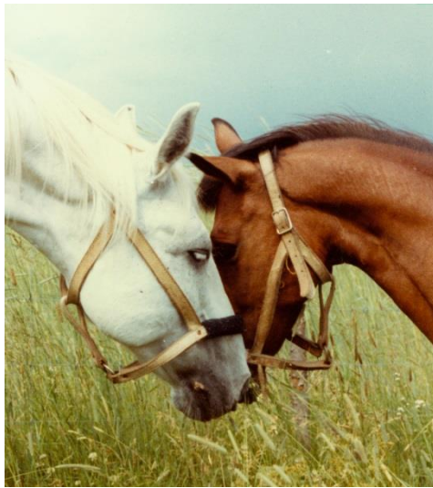
Ensimmäisten hevosten joukosta Hajduk & Luki

Shetlanninponeista pieni musta Tora oli kauan minun lemmikkini.