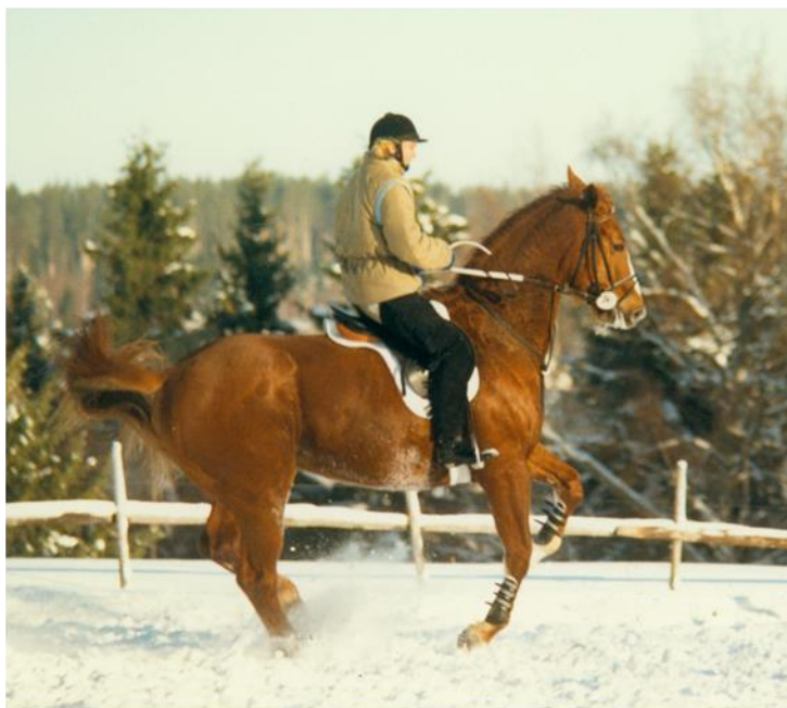
Talvitreenit Parkanossa 15.2.1987