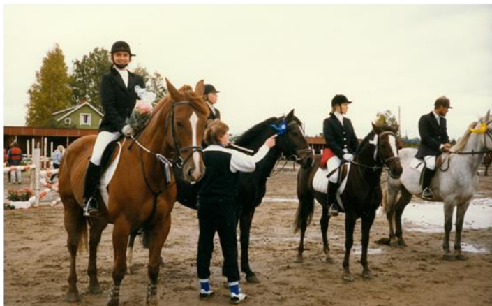
Voitto Porissa syksy 1986