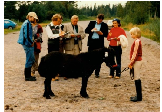
Toran autoin kantakirjaamaan Ypäjällä 1982.